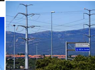
Doble línea de torres en Galapagar