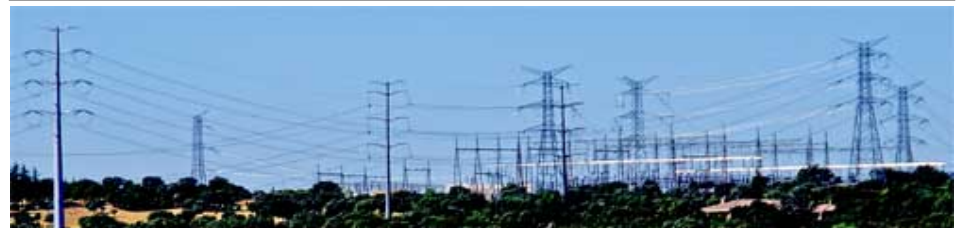
Subestación de Galapagar

En nuestro país hay capacidad de generación de energía eléctrica de sobra y se produce más electricidad de la que se consume, a pesar de las campañas que insinúan lo contrario. La prueba es que se tiene superávit en el comercio transfronterizo de electricidad y se lleva 7 años exportando a Portugal, Marruecos, Francia y Andorra, más de lo que se importa de Francia. Concretamente, en los últimos años se exportó entre el 2 y el 3% de la electricidad que se generó. Las líneas MAT son parte del negocio de las eléctricas, no una necesidad social.