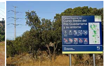
Torre en el Parque del Curso Medio del Río Guadarrama (Galapagar)