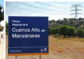
Torre en el Parque de la Cuenca Alta del Manzanares (Hoyo de Manzanares)