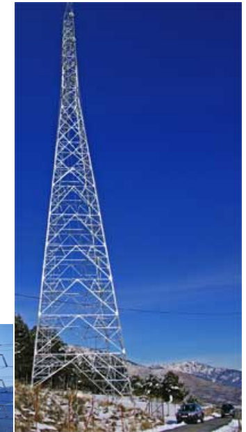
Torre de más de 76 metros, en la entrada al apeadero de La Tablada (Guadarrama)