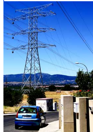
Torre con 3 circuitos y 29 cables, en Collado Villalba, junto al Mirador de la Sierra