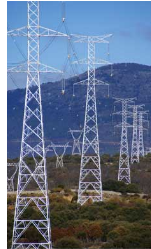
Torres en Alpedrete y Collado Mediano